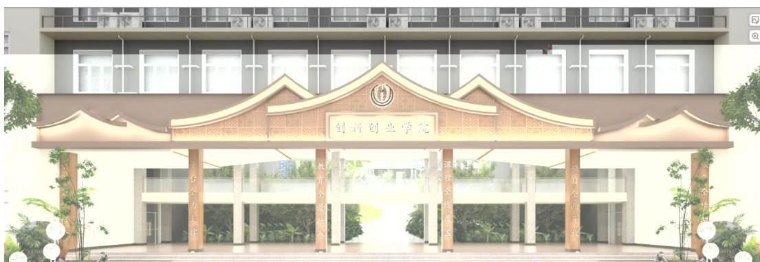
学院门头初步设计方案

创新创业学院内设创新创业教育中心、创新创业培训中心、创新创业实验中心、创新创业转化中心、创新创业科创中心。五大中心由创新创业学院办公室协调统筹。